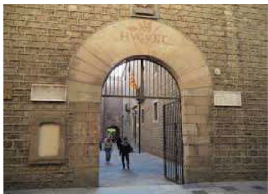
Entrada des del carrer Carme 47