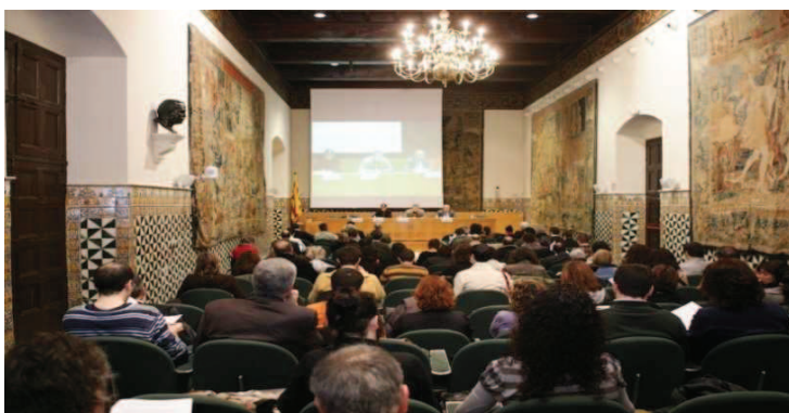
Sala Prat de la Riba