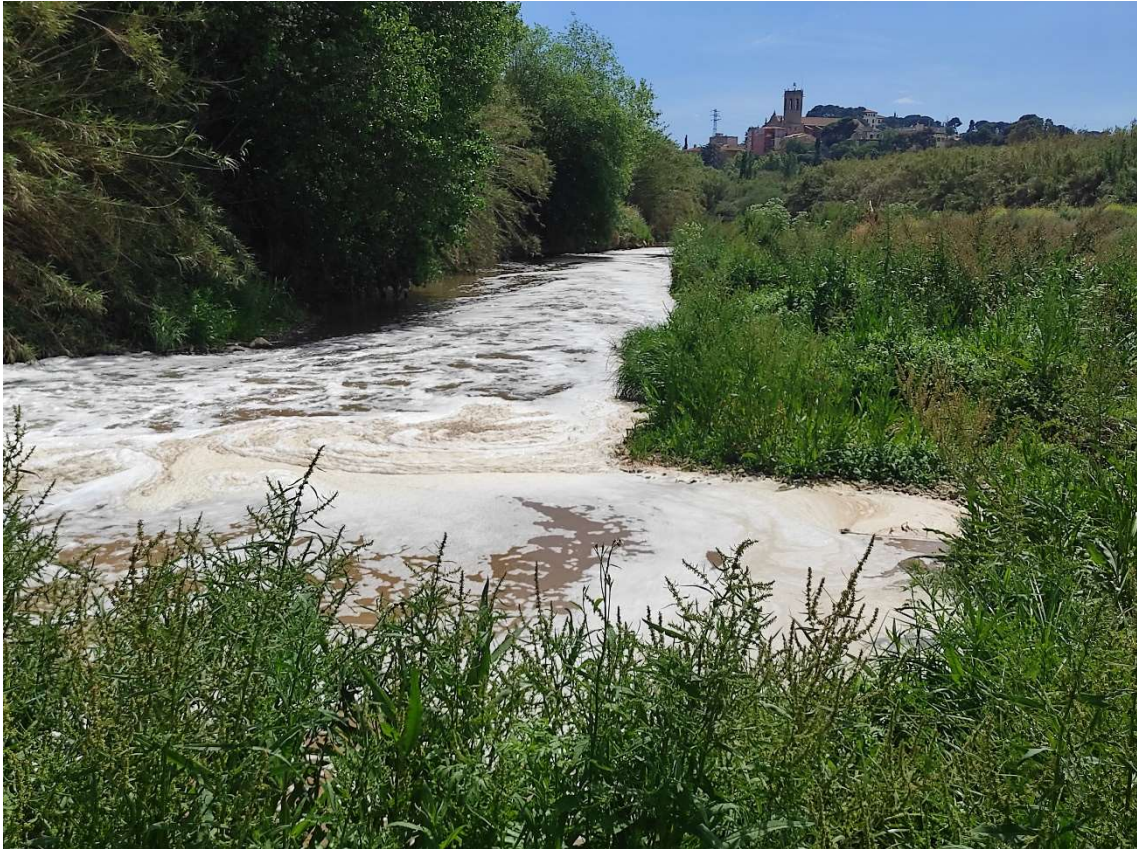
Escumes al riu Llobregat a l'alçada de Sant Boi de Llobregat (abril 2023)

Les noves actuacions que caldria abordar per a millorar el cicle de l'aigua a l'Àrea Metropolitana de Barcelona són: l'aprofitament del rec Comtal al Besòs i d'una potabilitzadora al riu Besòs, l'augment de l'explotació dels aqüífers del Besòs, la reutilització de les depuradores del Prat, Gavà- Viladecans, Sant Feliu, Besòs-Fòrum, Rubí, Mataró, la potenciació de la recàrrega als aqüífers al·luvials i deltaics del Llobregat, Besòs, i riera d'Argentona. Tot això ajudaria a la millora de la garantia de subministrament amb aigua de km0 aportant uns cabals superiors als 40 hm 3 /a.